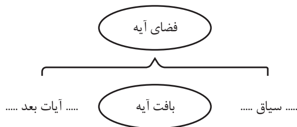
شکل ۲: تفاوت فضای آیه با بافت آیه

دوستی) با استفاده از مفاهیم عینی (حرکت و فاصله فیزیکی) بیان شده‌اند؛ بنابراین مفاهیم انتزاعی در ذهن انسان با بهره‌گیری از مفاهیم عینی سازمان‌بندی می‌شود. زبان‌شناسان شناختی بر خلاف زبان‌شناسان زایشی، زبان را نظامی جدا از سایر قوای ذهنی نمی‌دانند. لذا هر تعبیر قرآنی بر زمینه و بستر مفهوم سازی ویژه‌ای استوار شده است که با بررسی آن زمینه می‌توان مفهوم سازی تبیین شده در آیه را جست و به مراد متکلم و هدف او از طریق این مفهوم سازی‌ها نائل شد. مفهوم سازی آیات را باید در فضای آن‌ها در نظر گرفت. بنابراین باید میان بافت، سیاق و فضای آیه تفاوت قائل شویم. با توجه به شکل زیر می‌توان تفاوت این موارد را یافت: