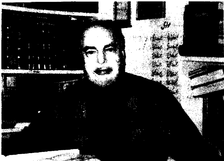
○ دکتر احمد مهدوی دامغانی

عزیز به آمریکا آمد و بنده با تلفن از شرق به غرب آمریکا از استماع صدا و سخنتش محظوظ شدم، جناب افشار باز هم: «با همان احتیاط کاری یزدیانه‌اش» و با «لیث و لعل» بسیار و تعارفات بی‌شمار اجازه فرمود که آن مقاله که اینک به لطف جناب دهباشی بنظر شما خوانندگان فاضل می‌رسد در گرامی‌نامه «کلک» به چاپ برسد. = والله علی ما نقول وکیل = البته امیدوارم که کار «جشن‌نامه»ی حضرت افشار نیز سامان یابد باشد تا در آن «جشن‌نامه» هویت علمی و ادبی افشار بیشتر مشخص شود و علیهذا از جناب باقرزاده خواهش می‌کنم همین که مقتضی قطعی انتشار آن تحقق پذیرفت در مهلت مناسب و مطلوبی مراتب را به مخلص اعلام فرمایند تا باز دوباره حقیر با دیده منت، «تدبیر نثاری بکنند» و مقاله دیگری تقدیم دارد. والحمد لله رب العالمین و صلی الله علی سیدنا محمد و آله الطاهیرین